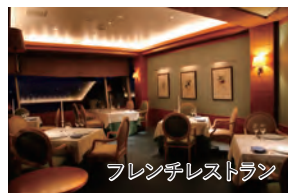
フレンチレストラン

旅行期間 2024年8月11日(日)～13日(火) 旅行代金 お一人様 219,000円(2名1室) ※新大阪駅発着以外をご希望の場合は、お問い合わせください。 募集人数 12名(最少催行人数10名) 添乗員 同行いたします 交通機関 JR新幹線【グリーン席・禁煙車】 現地貸切バス(運行バス会社:伊豆箱根バス) 食事条件 朝2回・昼2回・夕2回 宿泊施設 淡島/淡島ホテル(スタンダードスイートルーム・連泊)