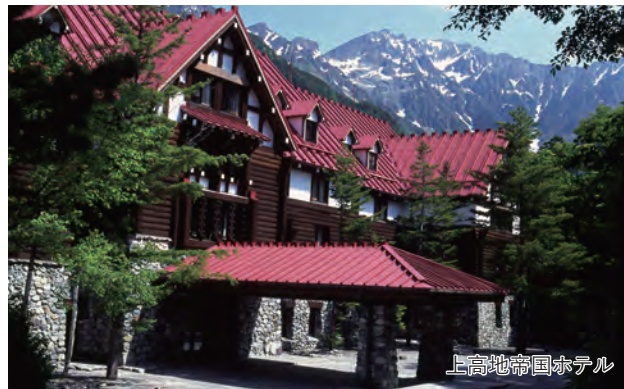
上高地帝国ホテル