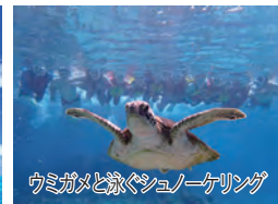
ウミガメと泳ぐシュノーケリング