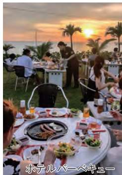
ホテルバーベキュー