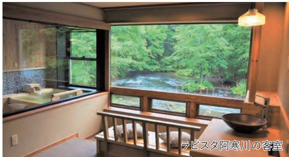
ラビスタ阿寒川の客室