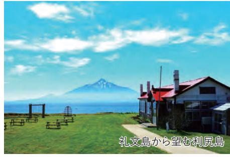
礼文島から望む利尻島