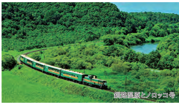
釧路湿原とノロッコ号