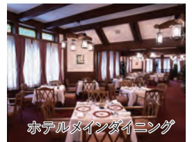
ホテルメインダイニング