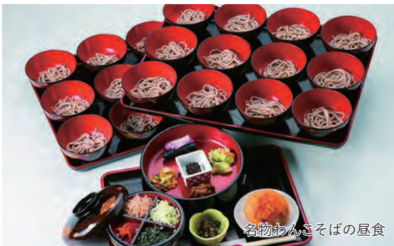
名物わんこそばの昼食