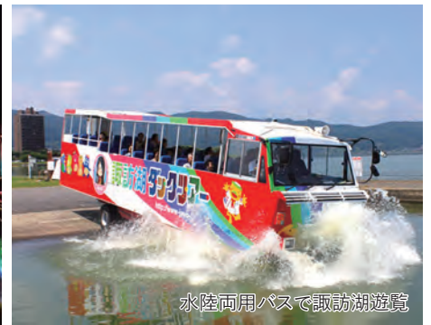
水陸両用バスで諏訪湖遊覧