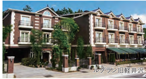
ルグラン旧軽井沢