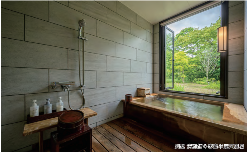
別荘 清流館の客室半露天風呂