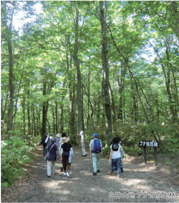
白神山地 ブナの原生林