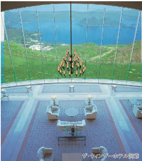
ザ・ウィンザーホテル洞爺