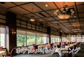
ホテルメインダイニング

旅行期間 2024年8月11日(日)～13日(火) 旅行代金 お一人様 248,000円(2名1室) ※新大阪駅発着以外ご希望の場合は、お問い合わせください。 募集人数 12名(最少催行人数10名) 添乗員 同行いたします 交通機関 JR山陽新幹線【グリーン席・禁煙車】 JR特急・西九州新幹線【普通指定席・禁煙車】 現地貸切バス(運行バス会社:東彼観光) 食事条件 朝2回・昼2回・夕2回 宿泊施設 雲仙温泉/Mt. Resort雲仙九州ホテル (60㎡ 温泉半露天風呂+テラス付和洋室)