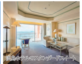
淡島ホテルのスタンダードスイートルーム