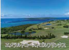
エメラルドコーストゴルフリンクス