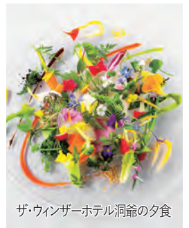
ザ・ウィンザーホテル洞爺の夕食