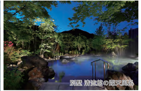
別荘 清流館の露天風呂