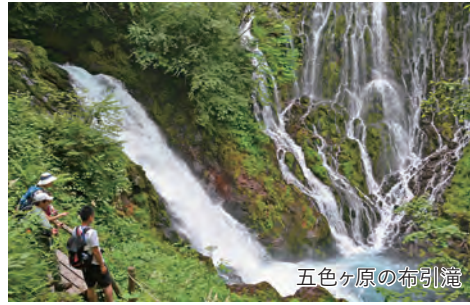
五色ヶ原の布引滝