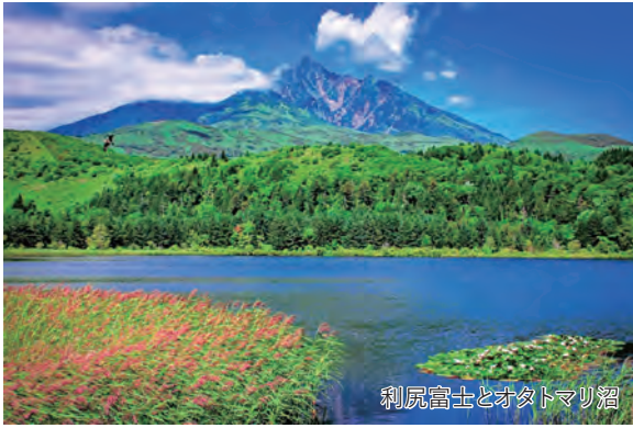
利尻富士とオタトマリ沼