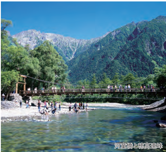
河童橋と穂高連峰