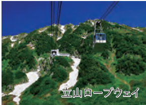
立山ロープウェイ

旅行期間 2024年8月11日(日)～13日(火) 旅行代金 お一人様 218,000円(2名1室) ※新大阪駅発着以外をご希望の場合は、お問い合わせください。 募集人数 16名(最少催行人数10名) 添乗員 同行いたします 交通機関 JR東海道新幹線【グリーン席・禁煙車】 JR北陸新幹線・特急【普通指定席・禁煙車】 現地貸切バス(運行バス会社:太陽バス・富山地方鉄道) 食事条件 朝2回・昼2回・夕2回 宿泊施設 白馬/白馬東急ホテル(洋室) 立山/ホテル森の風立山(本館・洋室)