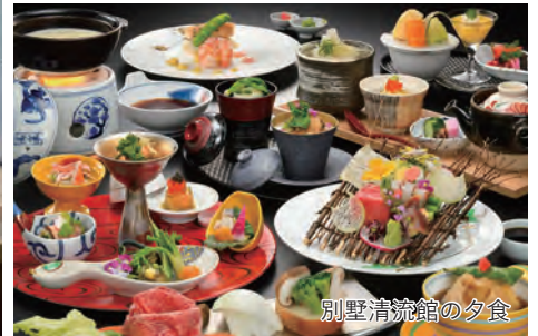
別荘清流館の夕食