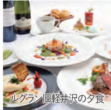
ルグラン旧軽井沢の夕食

旅行期間 2024年8月11日(日)～13日(火) 旅行代金 お一人様 298,000円(2名1室) ※新大阪駅発着以外ご希望の場合は、お問い合わせください。 ※2泊目と洋室ご希望の場合、お一人様10,000円追加 募集人数 14名(最少催行人数10名) 添乗員 同行いたします 交通機関 JR新幹線【グリーン席・禁煙車】 ※東京以遠は【普通指定席・禁煙車】 現地貸切バス(運行バス会社:共和観光バス) 食事条件 朝2回・昼2回・夕2回 宿泊施設 旧軽井沢/ルグラン旧軽井沢(ツインルーム) 山田温泉/藤井荘(月見縁台付和室)