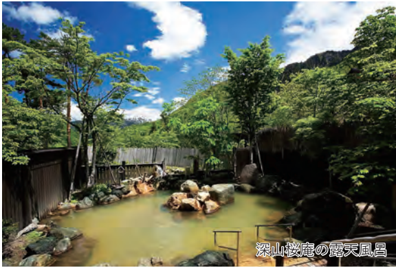
深山桜庵の露天風呂