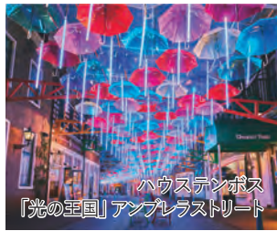
ハウステンボス 「光の王国」アンブレラストリート