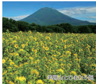
羊蹄山とひまわり畑