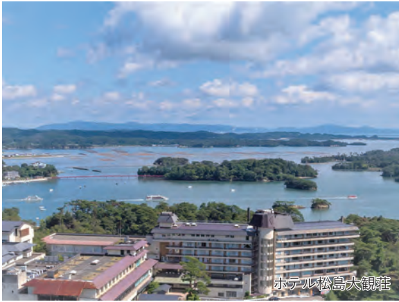
ホテル松島大観荘