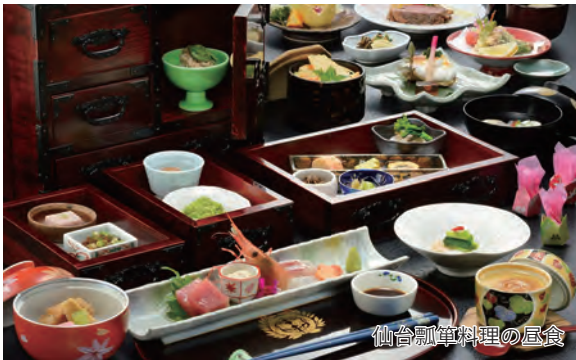
仙台筆筒料理の昼食