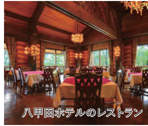
八甲田ホテルのレストラン