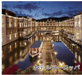
ホテルヨーロッパ