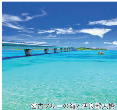
宮古ブルーの海と伊良部大橋