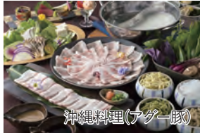
沖縄料理(アギー豚)