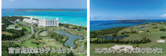
宮古島東急ホテル&リゾート