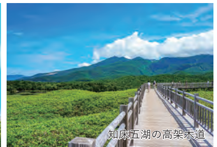
知床五湖の高架木道