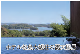
ホテル松島大観荘の露天風呂