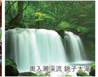
奥入瀬溪流 銚子大滝