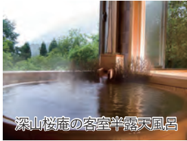
深山桜庵の客室半露天風呂

旅行期間 2024年8月11日(日)～13日(火) 旅行代金 お一人様 218,000円(2名1室) ※新大阪駅発着以外ご希望の場合は、お問い合わせください。 募集人数 16名(最少催行人数10名) 添乗員 同行いたします 交通機関 JR新幹線【グリーン席・禁煙車】 ※JR特急【普通指定席・禁煙車】 現地貸切バス(運行バス会社:濃飛バス) 食事条件 朝2回・昼3回・夕2回 宿泊施設 奥飛騨温泉郷/匠の宿「深山桜庵」(半露天風呂付和洋室)