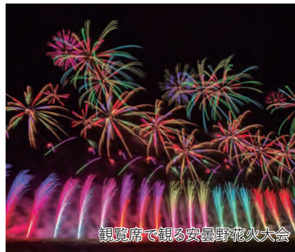
観覧席で観る安曇野花火大会