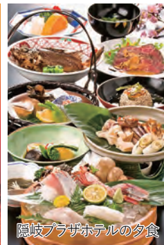
隠岐プラザホテルの夕食