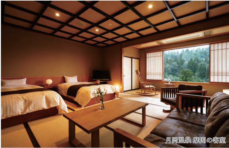
月岡温泉 摩周の客室