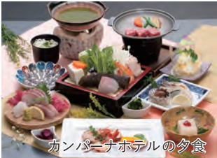
カンパーナホテルの夕食