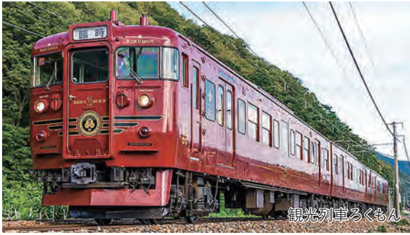
観光列車ろくもん