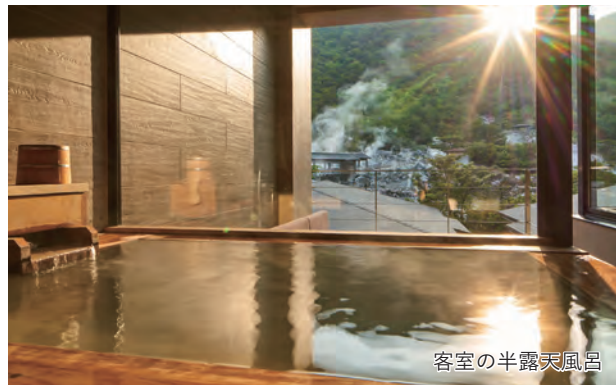
客室の半露天風呂