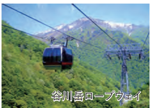
谷川岳ロープウェイ