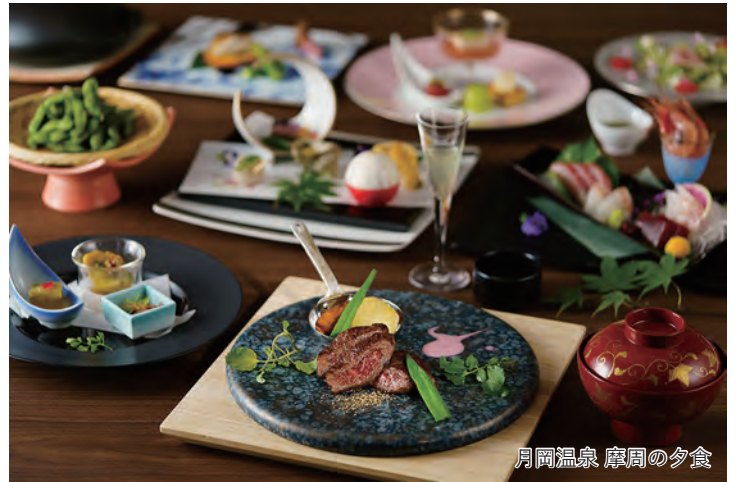
月岡温泉 摩周の夕食