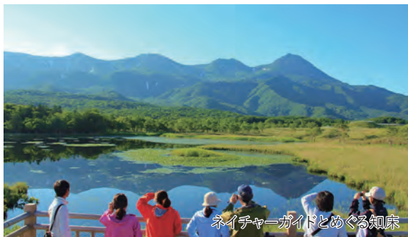
ネイチャーガイドとめぐる知床