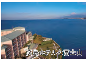
淡島ホテルと富士山