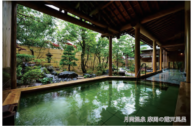
月岡温泉 摩周の露天風呂