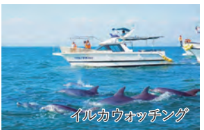
イルカウォッチング