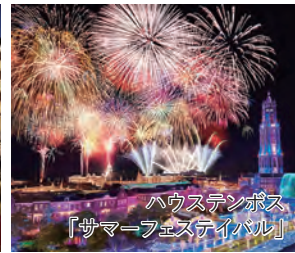
ハウステンボス 「サマーフェスティバル」