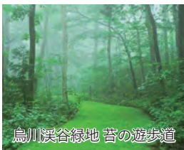
烏川渓谷緑地 苔の遊歩道

旅行期間 2024年8月13日(火)～15日(木) 旅行代金 お一人様 198,000円(2名1室) ※新大阪駅発着以外の場合はお問い合わせください。 募集人数 16名(最少催行人数10名) 添乗員 同行いたします 交通機関 JR新幹線【グリーン席・禁煙車】 JR特急【普通指定席・禁煙車】 現地貸切バス(運行バス会社:アルピコ交通又は同等バス) 食事条件 朝2回・昼3回・夕2回 宿泊施設 穂高温泉/安曇野穂高ビューホテル(和洋室・連泊)