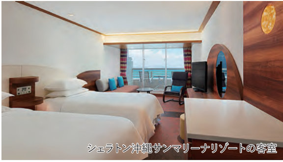
シェラトン沖縄サンマリーナリゾートの客室