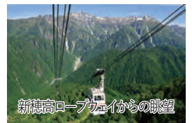
新穂高ロープウェイからの眺望

旅行期間 ① 2024年8月11日(日)～13日(火) ② 2024年8月13日(火)～15日(木) 旅行代金 お一人様 248,000円(2名1室) ※「ベランダ付きツイン」ご希望の場合、お一人様40,000円追加(2泊分) ※新大阪駅発着以外ご希望の場合は、お問い合わせください。 募集人数 各日18名(各日最少催行人数10名) 添乗員 同行いたします 交通機関 JR新幹線【グリーン席・禁煙車】 ※JR特急【普通指定席・禁煙車】 現地貸切バス(運行バス会社:栄和交通) 食事条件 朝2回・昼2回・夕2回 宿泊施設 上高地/上高地帝国ホテル(洋室・連泊)