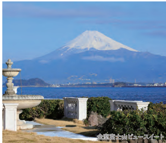
全室富士山ビュースイートルーム