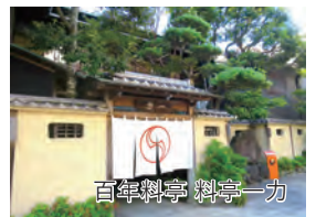
百年料亭 料亭一カ