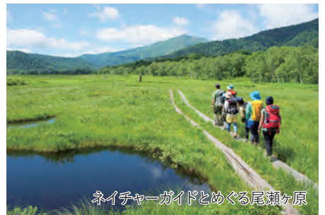
ネイチャーガイドとめぐる尾瀬ヶ原