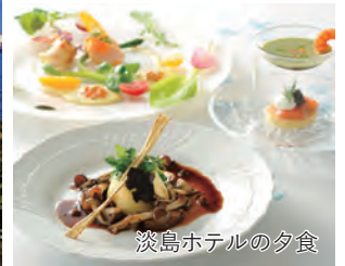
淡島ホテルの夕食