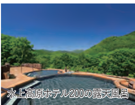
水上高原ホテル200の露天風呂