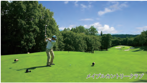
メイプルカントリークラブ