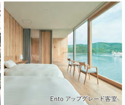
Ento アップグレード客室

旅行期間 2024年8月11日(日)～13日(火) 旅行代金 お一人様 238,000円(2名1室) ※2泊目客室タイプのアップグレード(52㎡/テラス、ビューバス(沸し湯/湯付き)をご希望の場合は、お一人様22,000円追加 募集人数 12名(最少催行人数10名) 添乗員 同行いたします 交通機関 航空機 現地貸切バス(運行バス会社:隠岐一畑交通、隠岐観光、海士交通) 食事条件 朝2回・昼2回・夕2回 宿泊施設 隠岐の島町/隠岐プラザホテル(和室または和洋室) 海士町(あまちょう)/Ento(別館・洋室(27㎡))