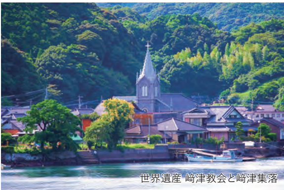
世界遺産 崎津教会と崎津集落