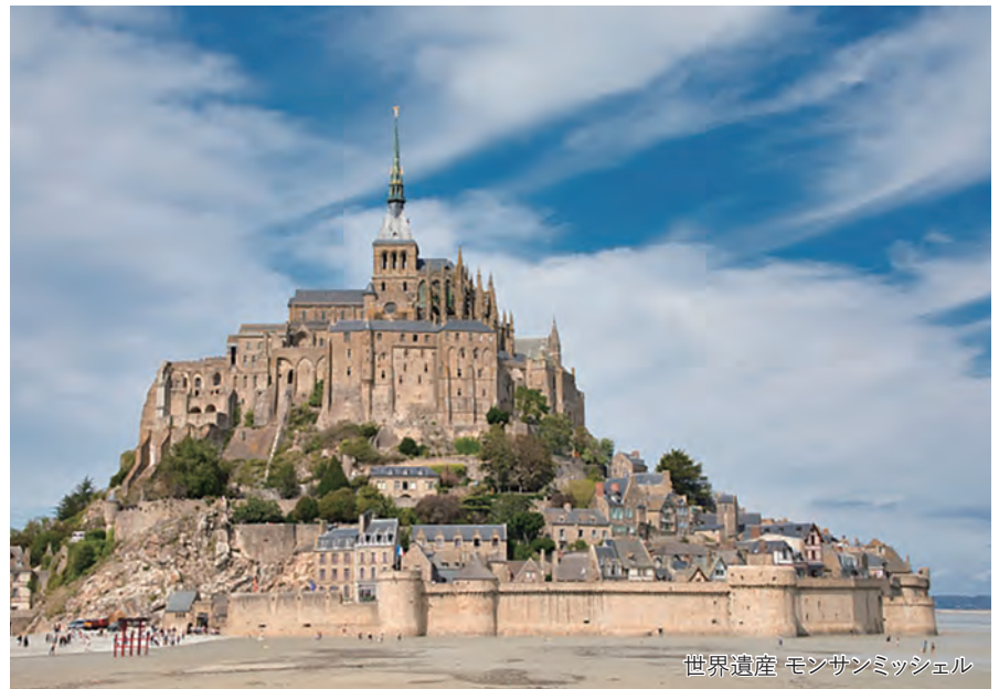
世界遺産 モンサンミッシェル