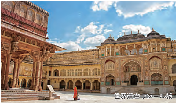
世界遺産 アメール城