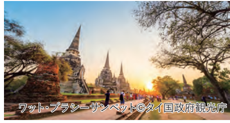
ワット・プラシーサンペット