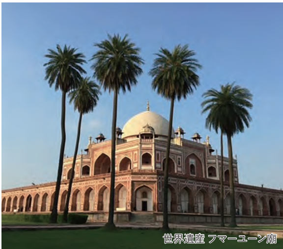
世界遺産 フマーユーン廟