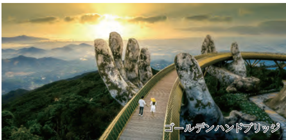
ゴールデンハンドブリッジ