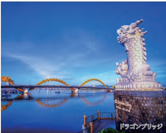
ドラゴンブリッジ