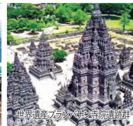
世界遺産 プランバナン寺院遺跡群