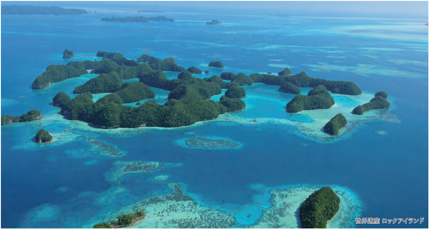
世界遺産 ロックアイランド