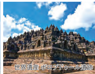
世界遺産 ボロブドゥール遺跡