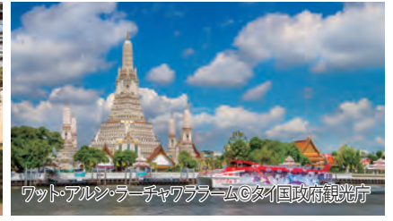
ワット・アルン・ラーチャワララム

旅行期間 2024年12月29日(日)～2025年1月3日(金) 旅行代金 お一人様 338,000円(2名1室/ルプアステートタワー) お一人様 368,000円(2名1室/タワークラブアットルプア) ※上記は全てエコノミークラス利用。 ※ビジネスクラスはお問い合わせください。 ※関西空港使用料(3,100円)、国際観光旅客税(1,000円)、 現地空港税(約5,200円)、燃油サーチャージ(エコノミークラ スは29,000円、ビジネスクラスは38,500円) 募集人数 10名(最少催行人数2名) 添乗員 同行しません 現地にて日本語ガイドがご案内いたします。 利用航空会社 タイ国際航空 食事条件 朝4回・昼0回・夕0回 ※機内食含まず 宿泊施設 ルプアステートタワー(ルプアシティービュー21-25 階) タワークラブアットルプア(スイートシティビュー51-59 階)