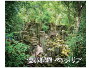
世界遺産 ペンメリア