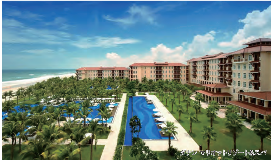
ダナン マリオットリゾート&スパ