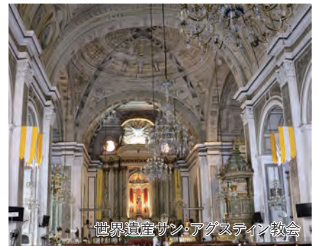
世界遺産サン・アグスティン教会