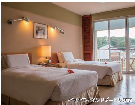
パラオロイヤルリゾートの客室