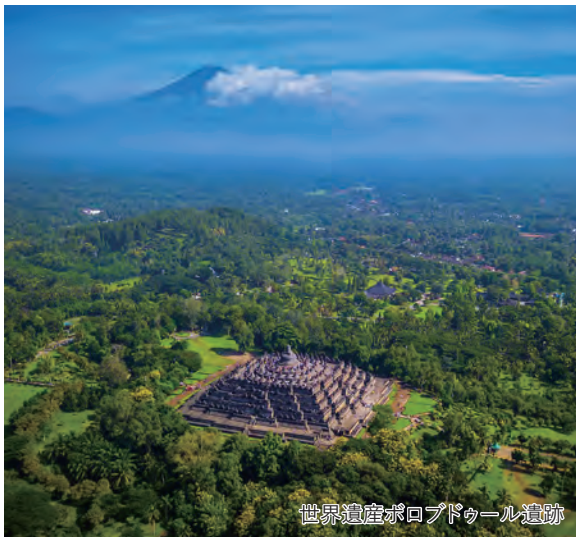
世界遺産ボロブドゥール遺跡