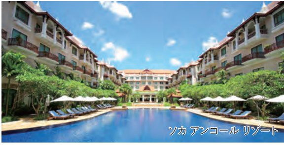
ソカ アンコール リゾート