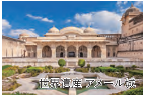
世界遺産 アメール城