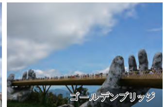
ゴールデンブリッジ

旅行期間 2024年12月29日(日)～2025年1月3日(金) 旅行代金 お一人様 348,000円(2名1室/メリアダナンビーチリゾート) お一人様 448,000円(2名1室/フラマーリゾートダナン) お一人様 668,000円(2名1室/インターコンチネンタルダナン) ※上記は全てエコノミークラス利用。 ※ビジネスクラスは350,000円追加。 ※関西空港使用料(3,100円)、国際観光旅客税(1,000円)、 現地空港税(約3,320円)、燃油サーチャージ(600円) 募集人数 10名(最少催行人数2名) 添乗員 同行しません 現地にて日本語ガイドがご案内いたします。 利用航空会社 ベトナム航空 食事条件 朝4回・昼0回・夕1回 ※機内食含まず 宿泊施設 メリアダナンビーチリゾート フラマーリゾートダナン インターコンチネンタルダナン