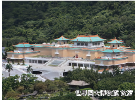
世界四大博物館 故宮