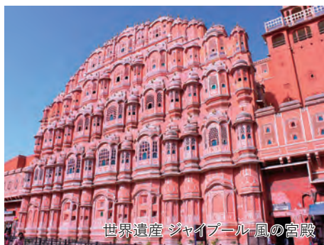
世界遺産 ジャイプール 風の宮殿