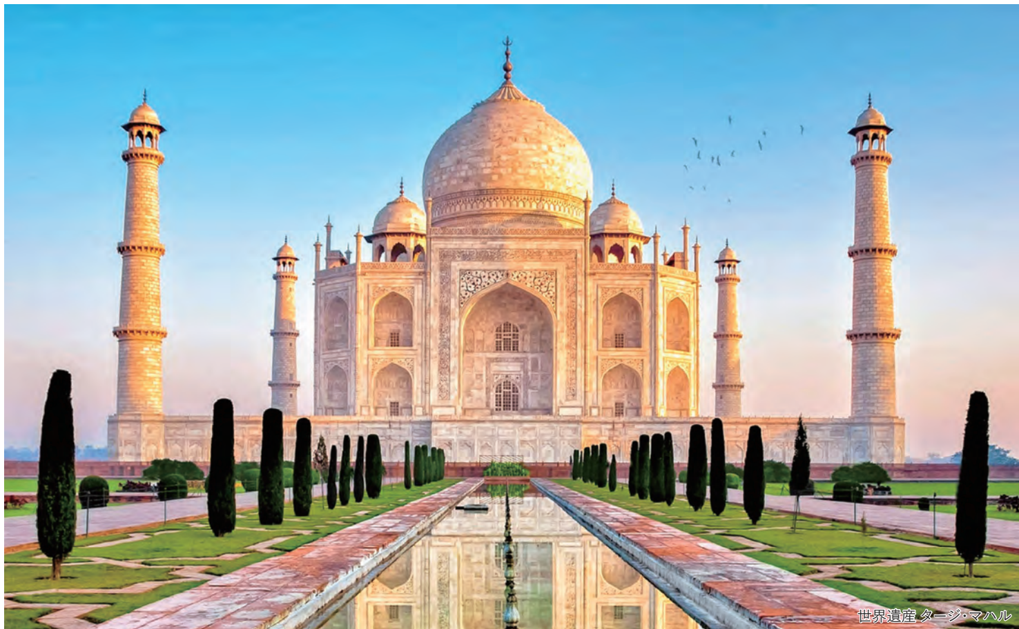
世界遺産 タージ・マハル