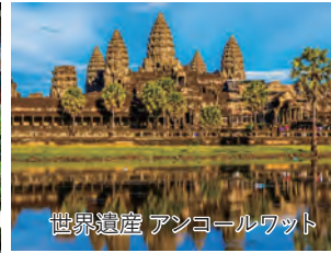
世界遺産 アンコールワット