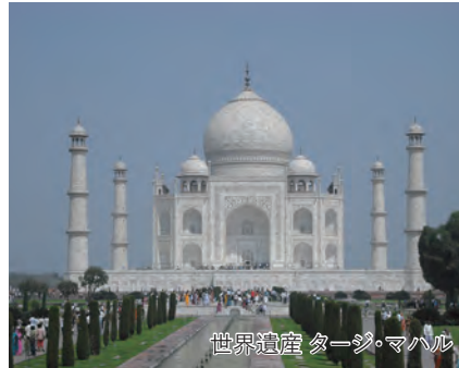
世界遺産 タージ・マハル