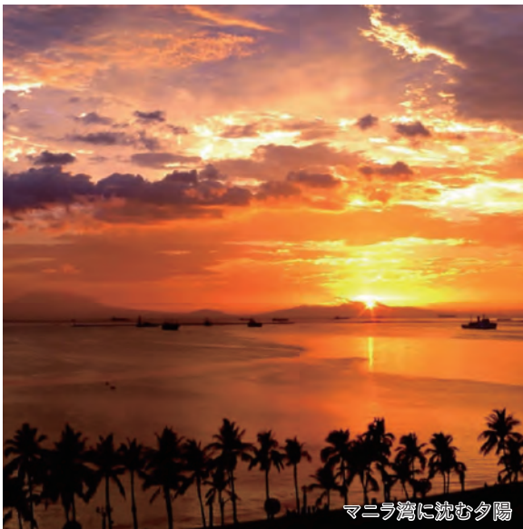
マニラ湾に沈む夕陽