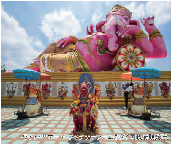
ワット・サマーン・ラツダカーラム