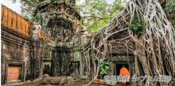
世界遺産 タ・プロム遺跡