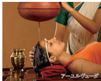
アーユルヴェーダ