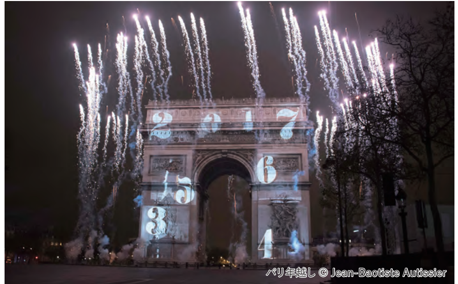
パリ年越し