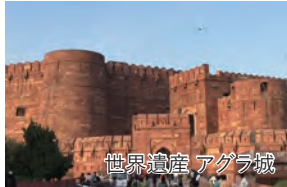
世界遺産 アグラ城