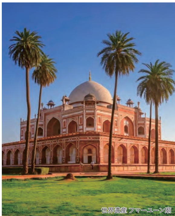
世界遺産 ファム・ユーン廟