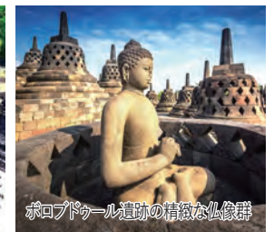
ボロブドゥール遺跡の精緻な仏像群