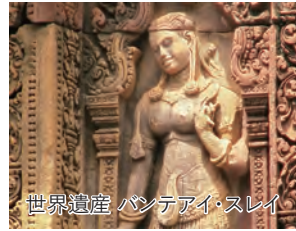
世界遺産 バンテアイ・スレイ