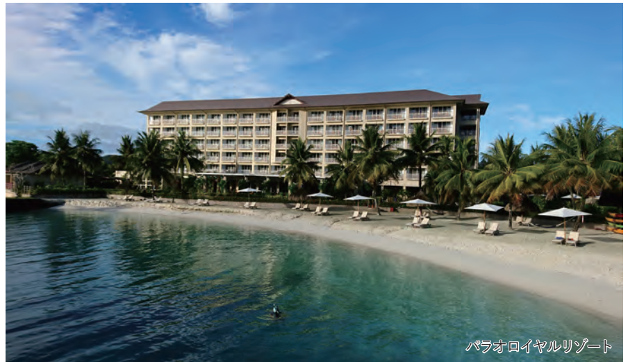
パラオロイヤルリゾート