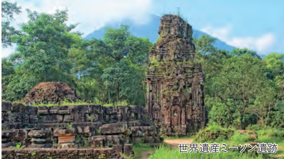
世界遺産ミーソン遺跡