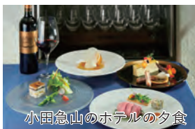
小田急山のホテルの夕食