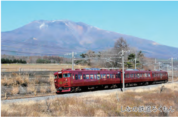
しなの鉄道ろくもん