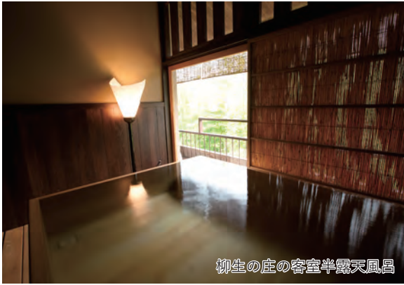
柳生の庄の客室半露天風呂