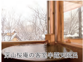
深山桜庵の客室半露天風呂