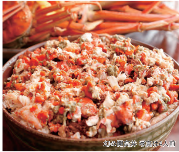
幻の開高丼 写真は4人前