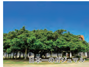
日本一のガジュマル

旅行期間 2025年1月12日(日)～13日(月・祝) 旅行代金 お一人様 178,000円(2名1室) ※伊丹空港以外の発着の場合はお問い合わせください。 募集人数 12名(最少催行人数10名) 添乗員 同行いたします 交通機関 航空機 現地貸切バス(運行バス会社:沖永良部バス企業団) 食事条件 朝1回・昼2回・夕1回 宿泊施設 沖永良部島/おきえらぶフローラルホテル(洋室)