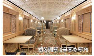
或る列車1号車の車内