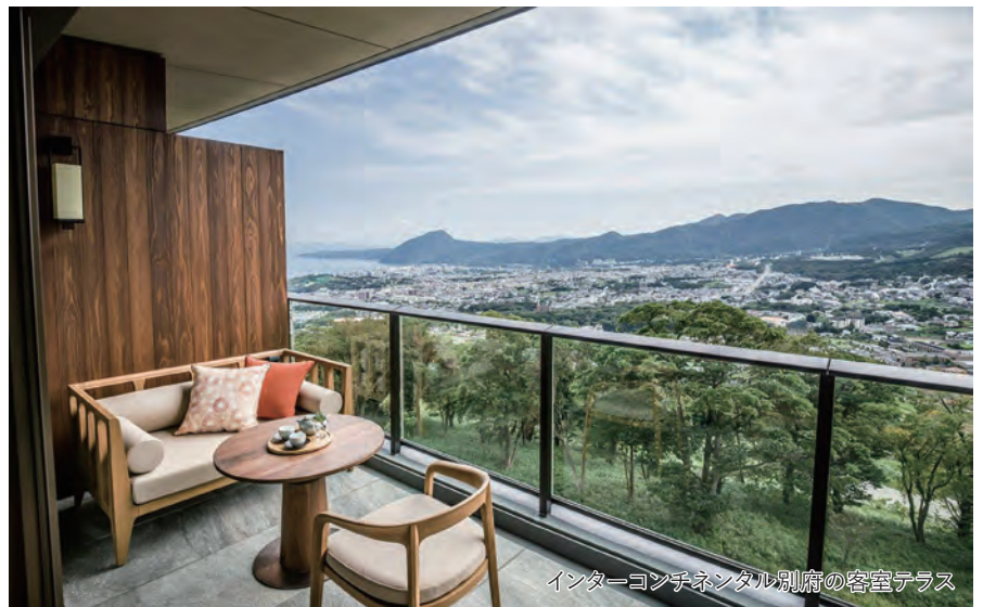
インターコンチネンタル別府の客室テラス