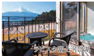
ラビスタ富士河口湖