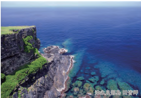
沖永良部島 田皆岬