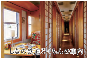
しなの鉄道ろくもんの車内