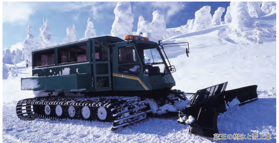
蔵王の樹氷と雪上車