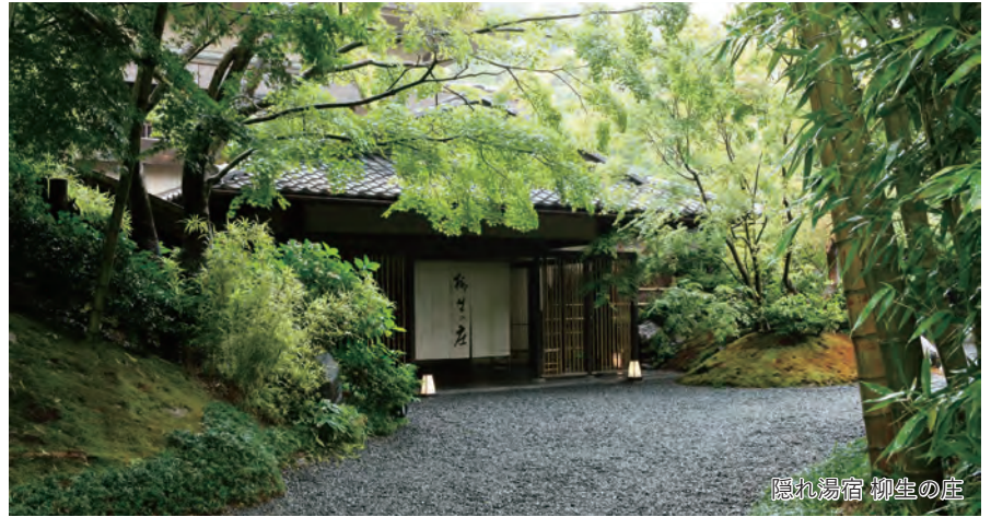
隠れ湯宿 柳生の庄