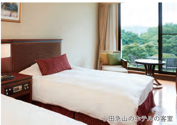
小田急山のホテルの客室