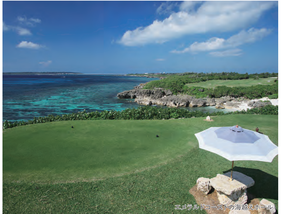
エメラルドコーストの海越えホール