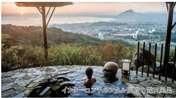
インターコンチネンタル別府の露天風呂