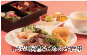
しなの鉄道ろくもんの食事