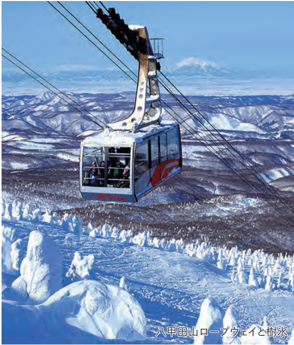
八甲田山ロープウェイと樹氷