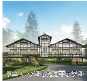
リニューアルした万平ホテル