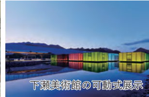
下瀬美術館の可動式展示

旅行期間 2025年1月12日(日)～13日(月・祝) 旅行代金 お一人様 218,000円(2名1室/キールステックの家50㎡) ※新大阪駅発着以外ご希望の場合は、お問い合わせください。 募集人数 10名(最少催行人数8名) 添乗員 同行いたします 交通機関 JR新幹線【グリーン席・禁煙車】 現地貸切バス(運行バス会社:広交観光バス) 食事条件 朝1回・昼2回・夕1回 宿泊施設 広島県大竹市/Simose Art Garden Villa(水辺のヴィラ)