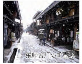
飛騨古川の町並み