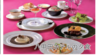
八甲田ホテルの夕食

旅行期間 2025年2月23日(日)～24日(月・祝) 旅行代金 お一人様 159,000円(2名様1室) 募集人数 12名(最少催行人数10名) 添乗員 青森空港より同行いたします 交通機関 航空機・現地貸切バス(運行バス会社:光洋観光バス) 食事条件 朝1回・昼1回・夕1回 宿泊施設 酸ヶ湯温泉／八甲田ホテル(洋室)