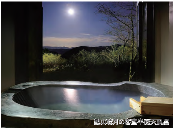
観山聴月の客室半露天風呂