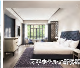
万平ホテルの新客室