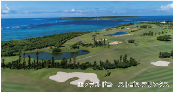
エメラルドコーストゴルフリンクス