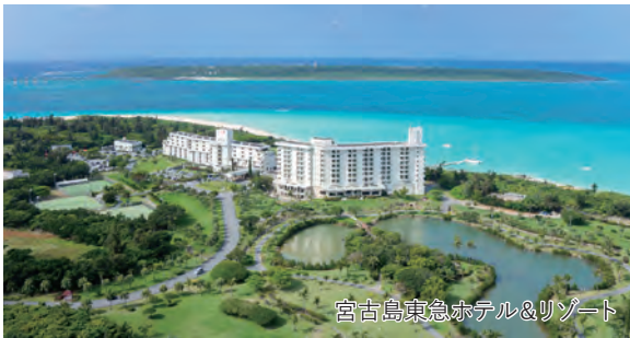
宮古島東急ホテル&リゾート