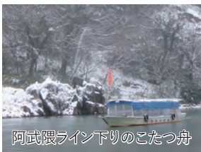
阿武隈ライン下りのこたつ舟