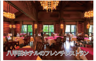
八甲田ホテルのフレンチレストラン