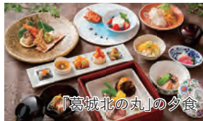
「葛城北の丸」の夕食