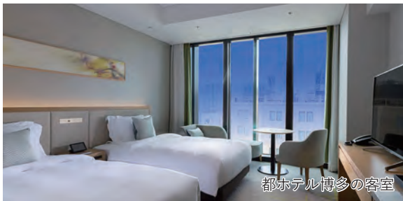
都ホテル博多の客室