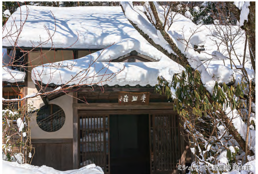
ミシュラン2つ星獲得 美山荘