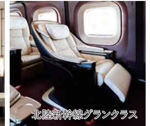
北陸新幹線グランクラス