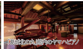
「葛城北の丸」館内のヤマハピアノ