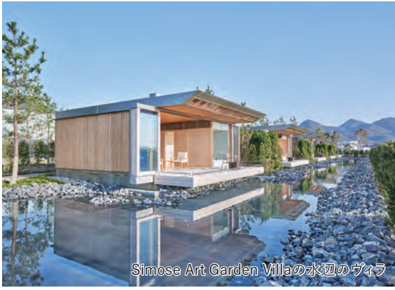
Simose Art Garden Villaの水辺のヴィラ