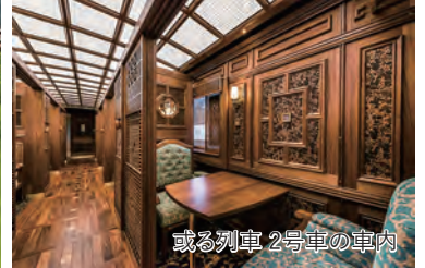
或る列車2号車の車内