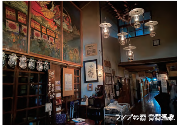
ランプの宿 青荷温泉