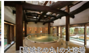
「葛城北の丸」の大浴場