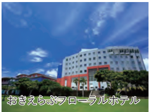
おきえらぶフローラルホテル