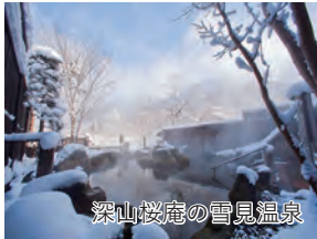
深山桜庵の雪見温泉