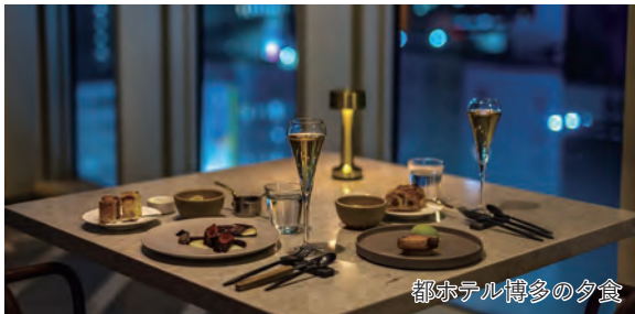
都ホテル博多の夕食