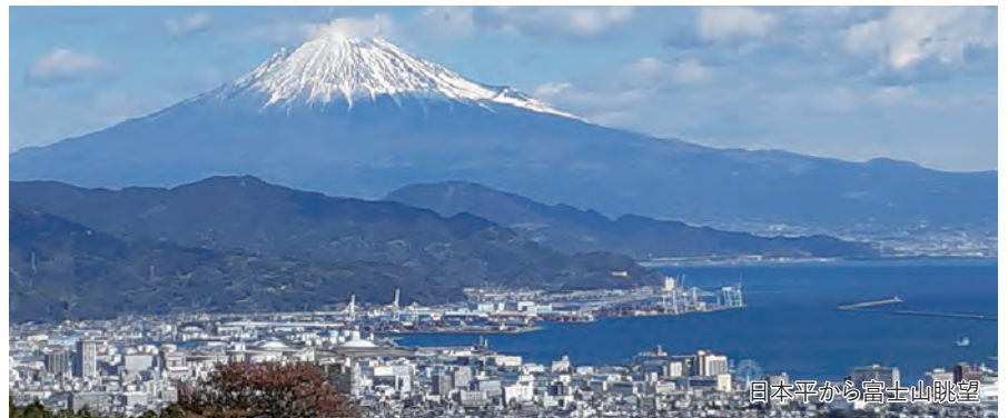
日本平から富士山眺望