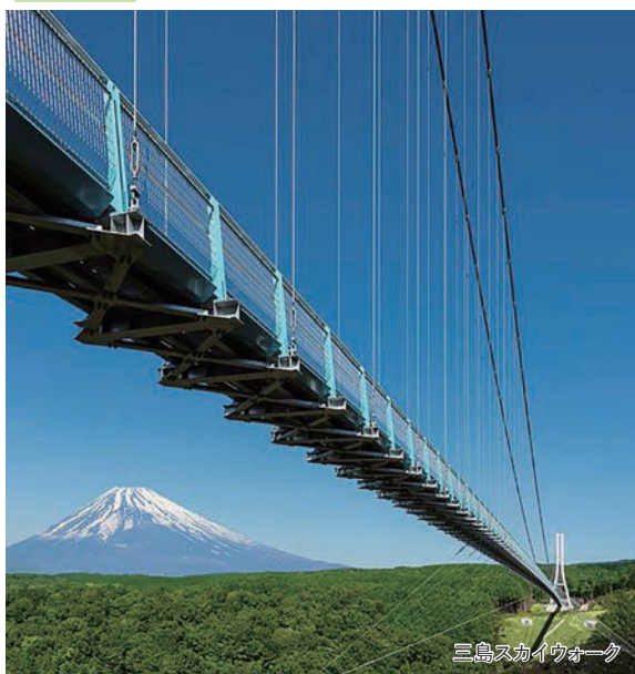
三島スカイウォーク