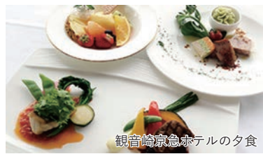
観音崎京急ホテルの夕食