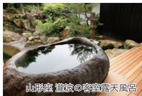
山形座 瀧波の客室露天風呂