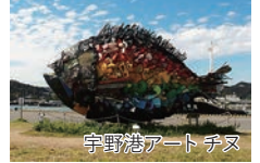
宇野港アート チヌ