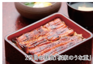
1日目の昼食「桜家のうなぎ」