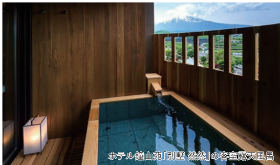
ホテル鐘山苑「別荘 然然」の客室露天風呂