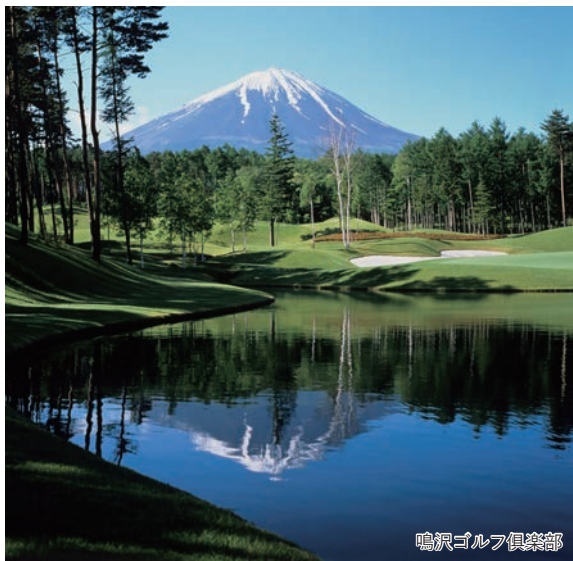
鳴沢ゴルフ倶楽部

～霊峰富士を望む国内屈指の名コースでプレー～ 富士山温泉 ホテル鐘山苑に泊まる 山梨3日間