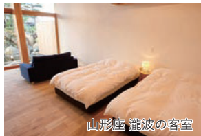
山形座 瀧波の客室