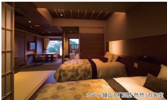
ホテル鐘山苑「別荘 然然」の客室