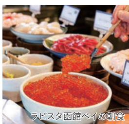
ラビスタ函館ベイの朝食