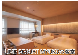
LIME RESORT MYOKOの客室