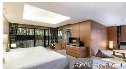
スタイリッシュスイート