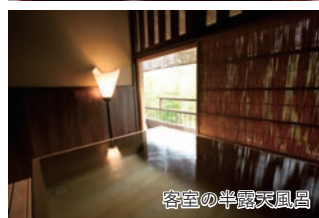
客室の半露天風呂