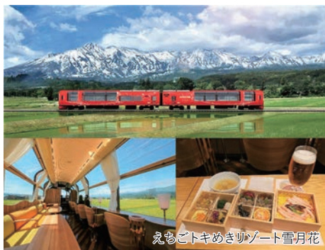
えちごトキめきリゾート雪月花