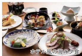
ホテル風の海の夕食