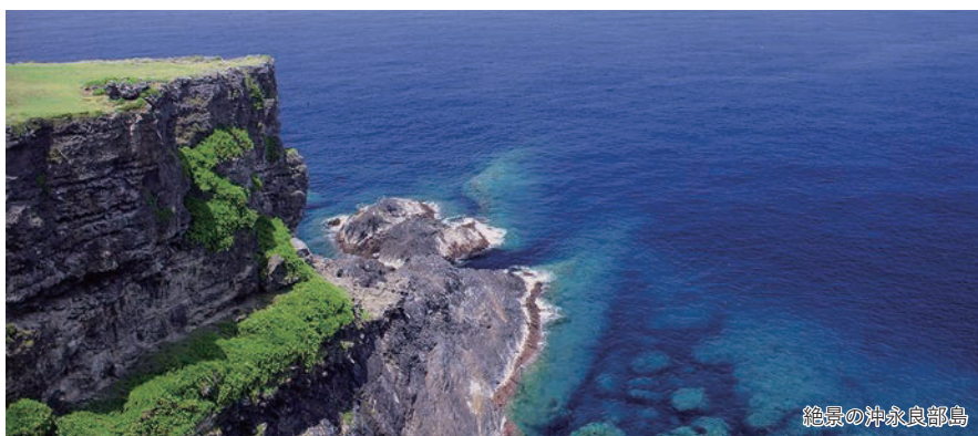
絶景の沖永良部島