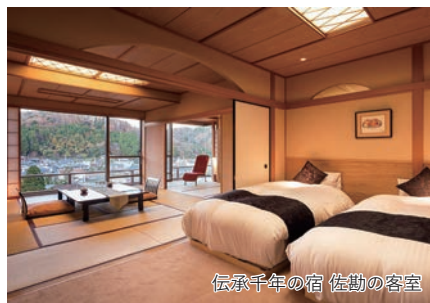
伝承千年の宿 佐勤の客室