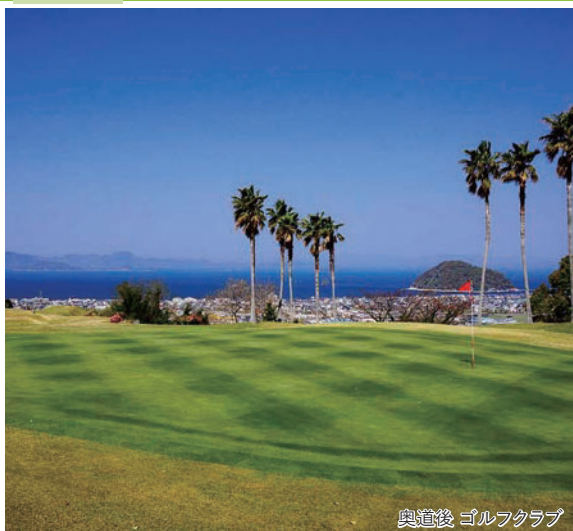
奥道後ゴルフクラブ

～瀬戸内海のドラマチックコース 松山シーサイドCCに挑戦～ 道後温泉・露天風呂付客室で過ごす 愛媛3日間