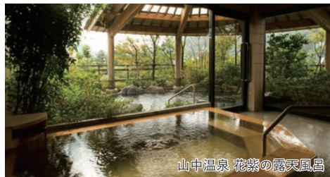
山中温泉 花紫の露天風呂