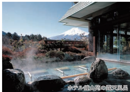
ホテル鐘山苑の露天風呂