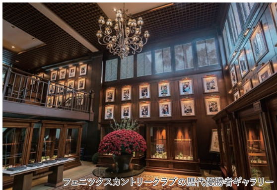
フェニックスカントリークラブの歴代優勝者ギャラリー