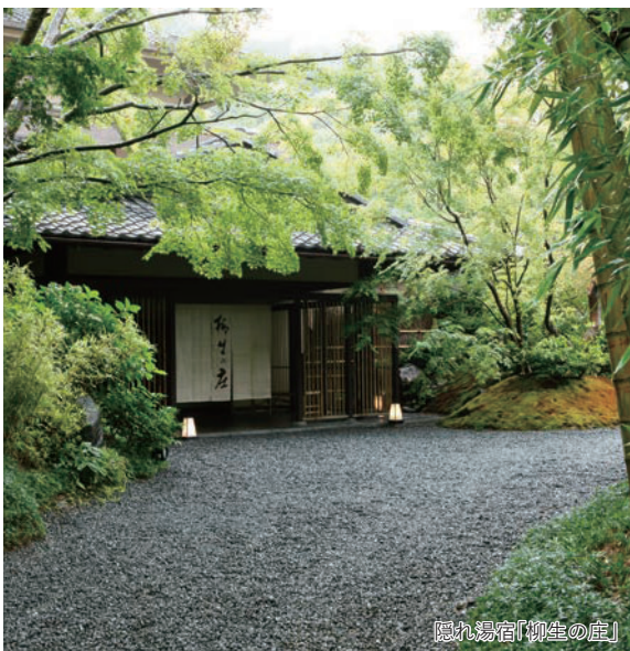
隠れ湯宿「柳生の庄」