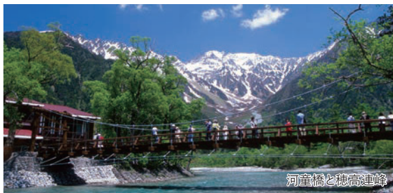
河童橋と穂高連峰