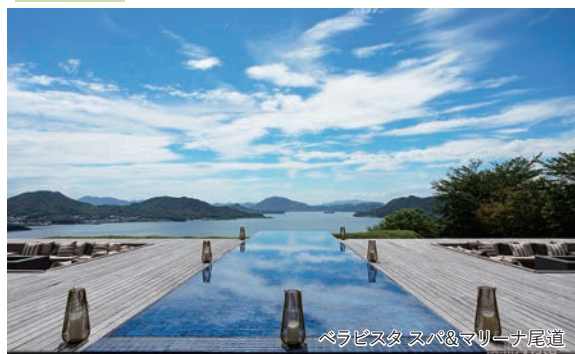
ペラピスタ スパ&マリナー尾道