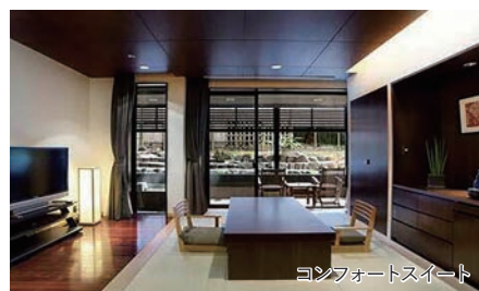
コンフォートスイート