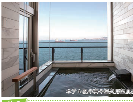
ホテル風の海の温泉展望風呂