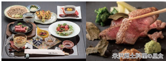
米沢郷土料理の昼食