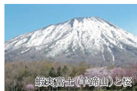
銀夷富士(羊蹄山)と桜