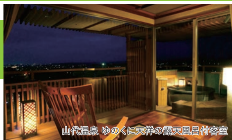
山代温泉 ゆのくに天祥の露天風呂付客室