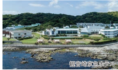
観音崎京急ホテル