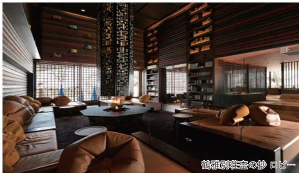
鶴雅別荘の抄 ロビー