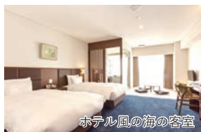
ホテル風の海の客室