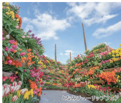
となみチューリップフェア