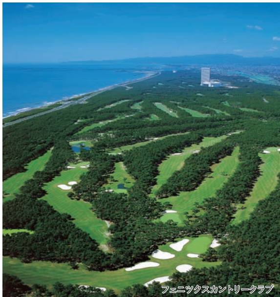
フェニックスカントリークラブ