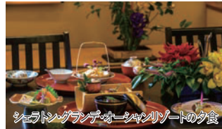
シェラトン・グランデ・オーシャンリゾートの夕食