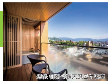
道後 御湯の露天風呂付客室