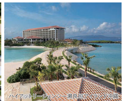
ハイアットリージェンシー 瀬良垣アイランド沖縄