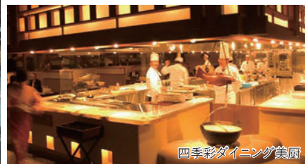
四季彩ダイニング美厨