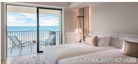
ハレクラニ沖縄のプレミアム客室