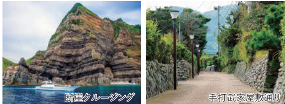
断崖クルージング

※現地では良いホテルをご用意しておりますが、離島のため弊社ツアーで通常利用する高級旅館ではございません。