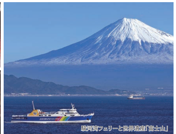
駿河湾フェリーと世界遺産「富士山」