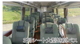
3列シート大型特別バス