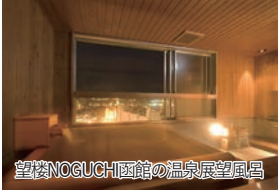
望楼NOGUCHI函館の温泉展望風呂