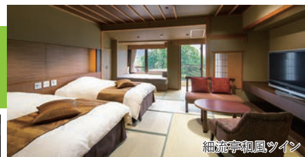
細流亭和風ツイン