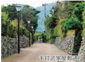
手打武家屋敷通り