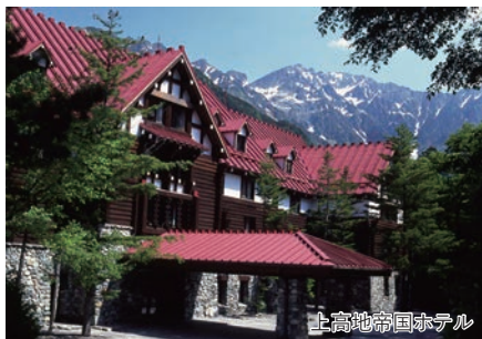
上高地帝国ホテル