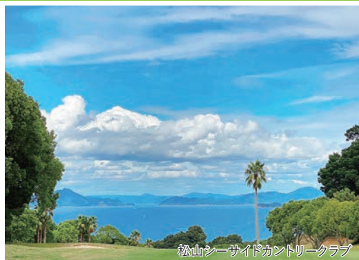
松山シーサイドカントリークラブ