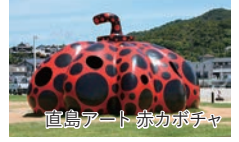
直島アート 赤カボチャ