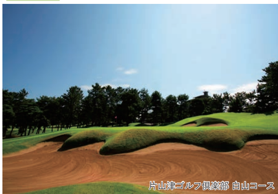
片山津ゴルフ倶楽部 白山コース