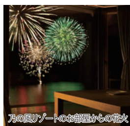
乃の風リゾートのお部屋からの花火