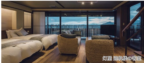
灯屋 迎帆楼の客室