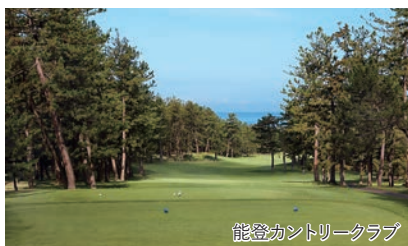
能登カントリークラブ