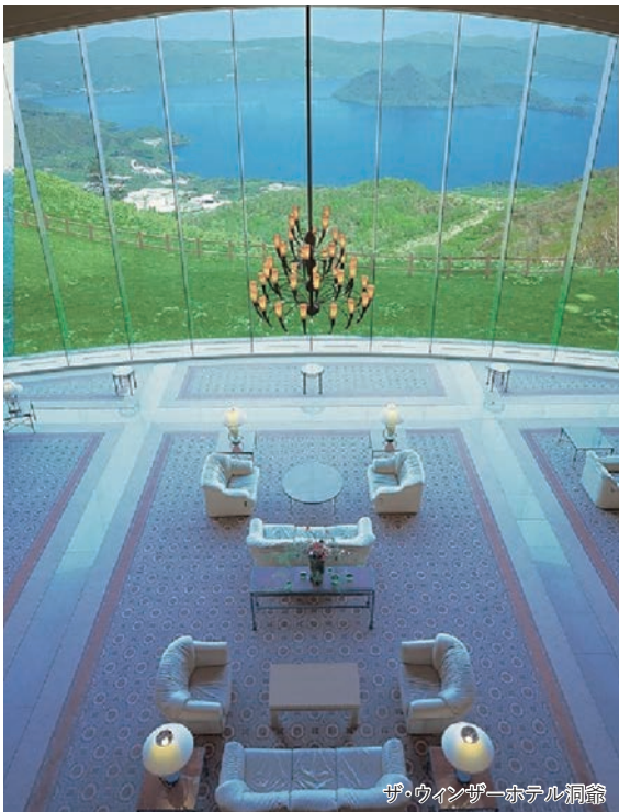
ザ・ウィンザーホテル洞爺