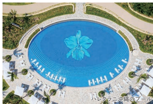
ハレクラニ沖縄のプール