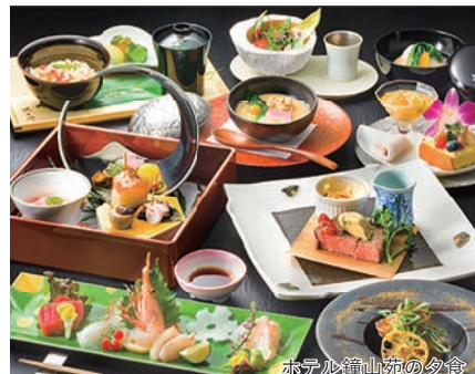
ホテル鐘山苑の夕食