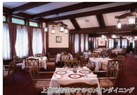
上高地帝国ホテルのメインダイニング