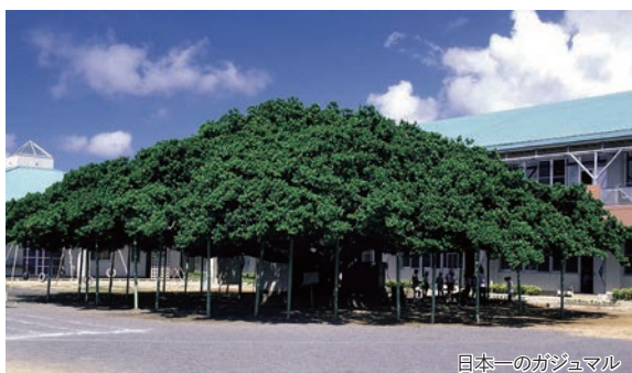
日本一のガジュマル