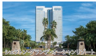
シェラトン・グランデ・オーシャンリゾート