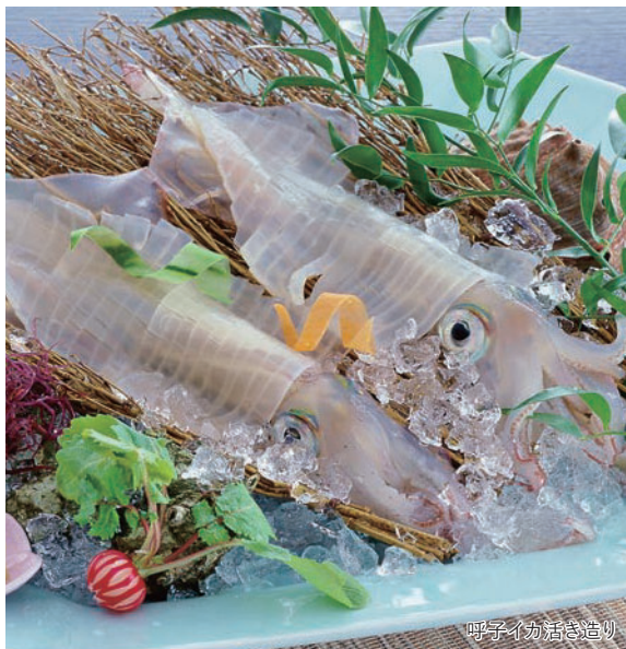
呼子イカ活き造り