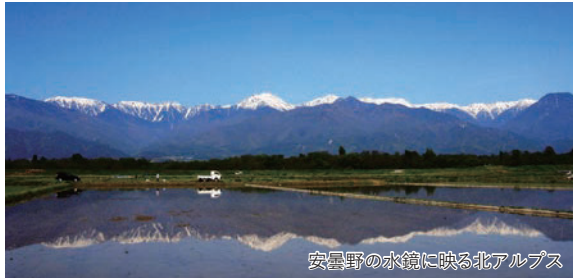
安曇野の水鏡に映る北アルプス