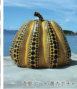
直島アート 黄カボチャ