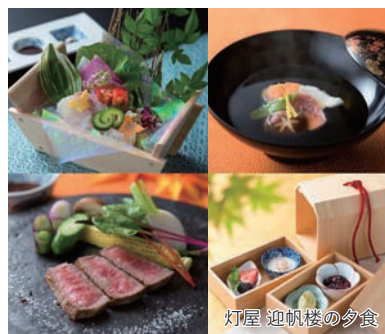
灯屋 迎帆楼の夕食