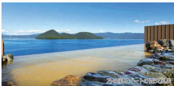
乃の風リゾートの露天風呂

旅のPoint ◎北海道の2大都市(函館～札幌)を結ぶ特急「北斗」と、室蘭～札幌を結ぶ特急「すずらん」に乗って、春の北海道を横断します。北海道らしい雄大な景色を駆け抜ける爽やかな列車旅をお楽しみください。 ◎函館一の眺望と日本一贅沢な朝食が自慢の「ラビスタ函館ベイ」にご宿泊。ご希望の方は、車で約5分のところにある函館ロープウェイで、函館の夜景観賞もお楽しみいただけます。2泊目は、洞爺湖を望む「ザレイクビューTOYA乃の風リゾート」にご宿泊。お部屋からは期間限定の「洞爺湖ロングラン花火大会」もお楽しみいただけます。