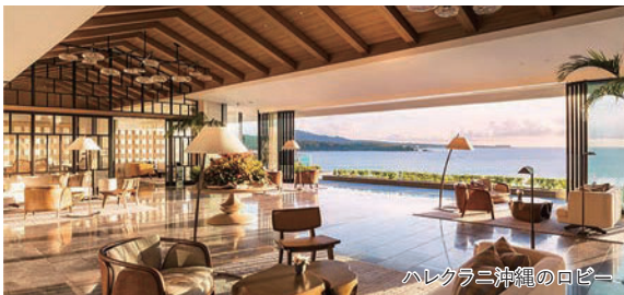
ハレクラニ沖縄のロビー