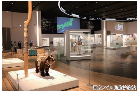
国立アイヌ民族博物館