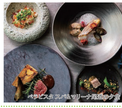
ペラピスタ スパ&マリナー尾道の夕食