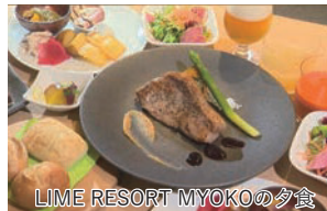
LIME RESORT MYOKOの夕食