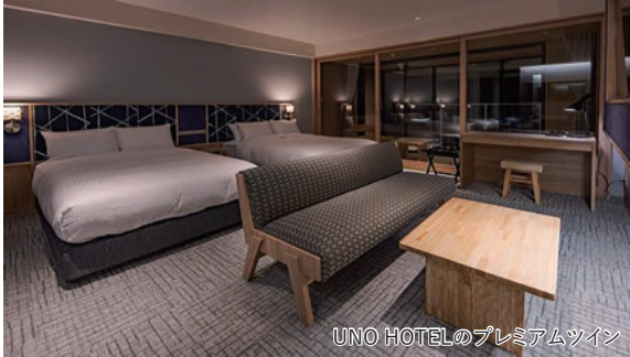
UNO HOTELのプレミアムツイン