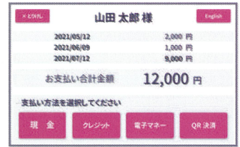
④支払方法選択画面