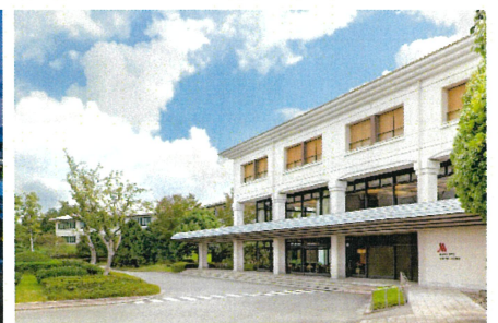
【伊豆マリオットホテル修善寺】