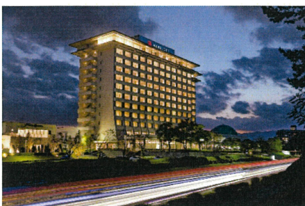
【びわ湖マリオットホテル】