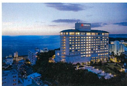
【南紀白浜マリオットホテル】