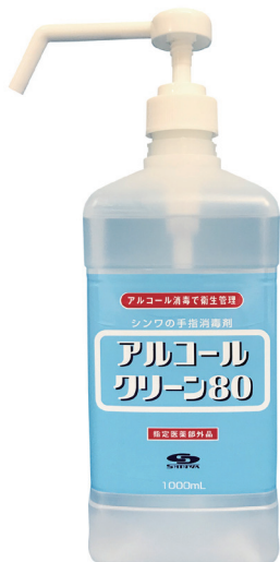
(シャワーポンプ付)