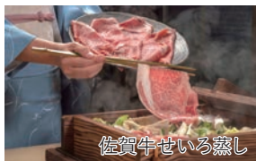
佐賀牛せいろ蒸し