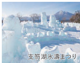
支笏湖氷濤まつり