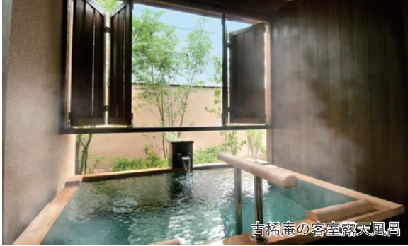
古稀庵の客室露天風呂