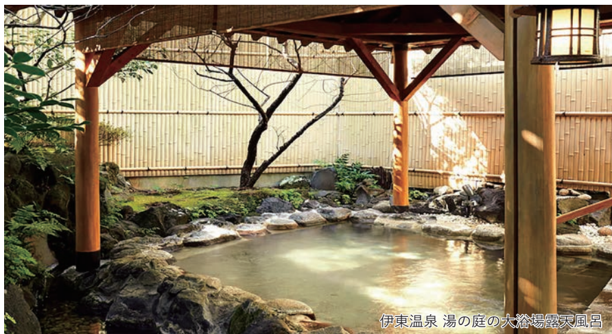
伊東温泉 湯の庭の大浴場露天風呂