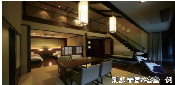
別邸 音信の客室一例