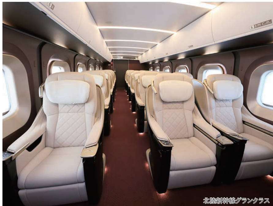
北陸新幹線グランクラス