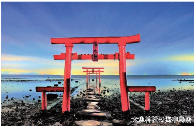
大魚神社の海中鳥居