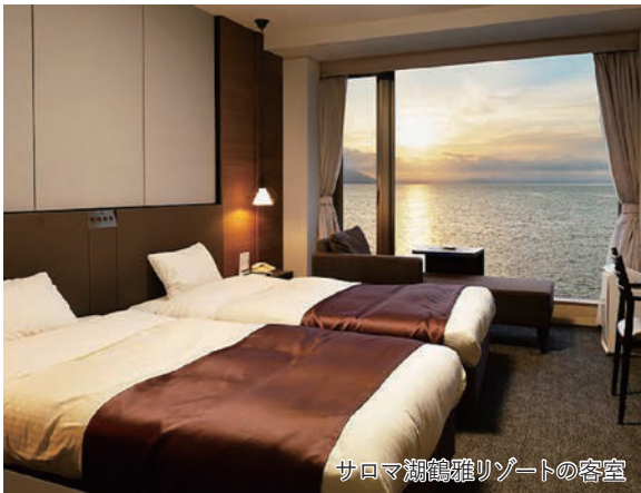
サロマ湖鶴雅リゾートの客室