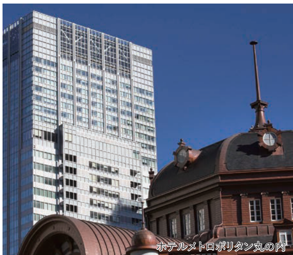
ホテルメトロポリタン丸の内