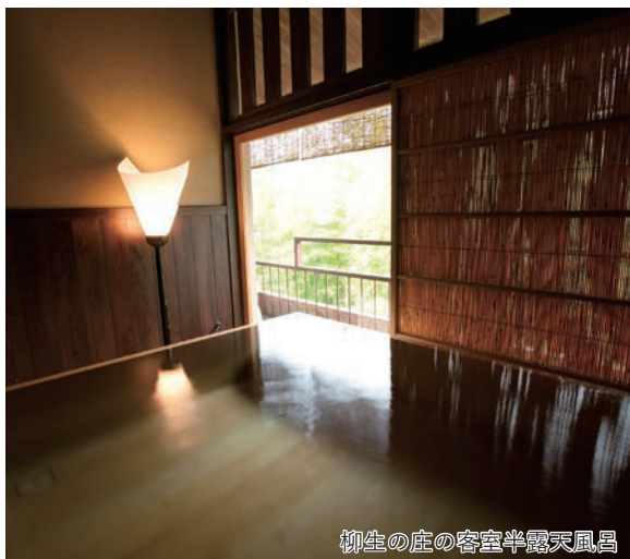
柳生の庄の客室半露天風呂