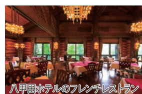
八甲田ホテルのフレンチレストラン