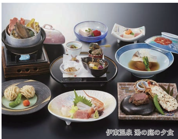
伊東温泉 湯の庭の夕食