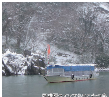
阿武隈ライン下りのこたつ舟