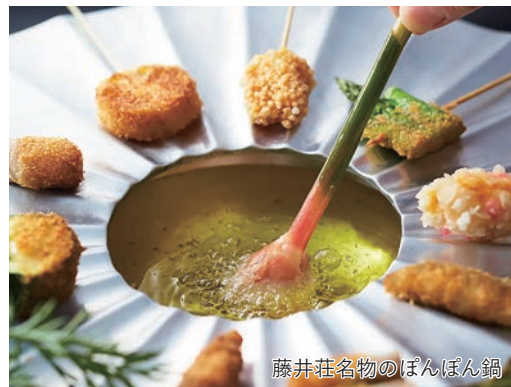
藤井荘名物のぼんぼん鍋