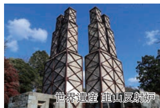
世界遺産 韮山反射炉