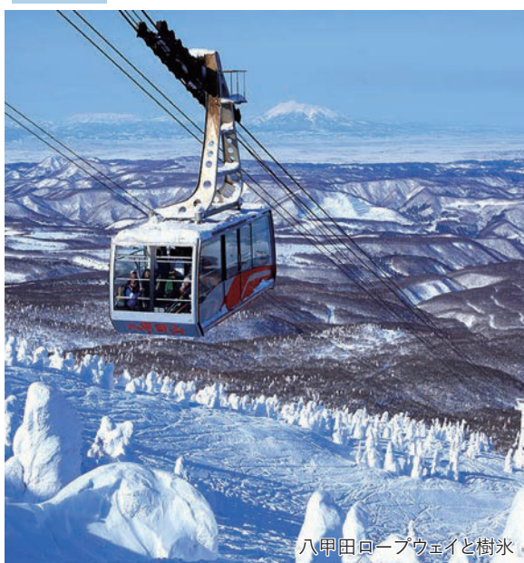
八甲田ロープウェイと樹氷