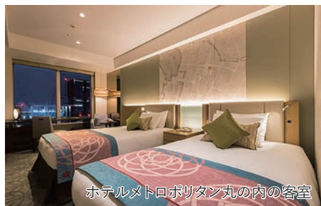
ホテルメトロポリタン丸の内の客室