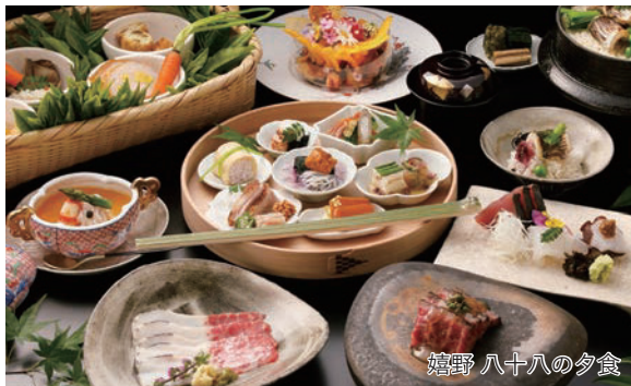
嬉野 八十八の夕食