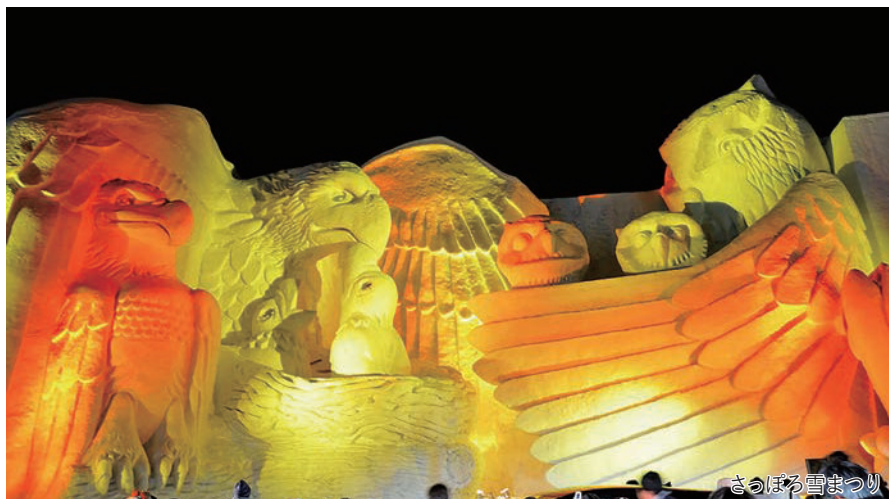
さっぽろ雪まつり