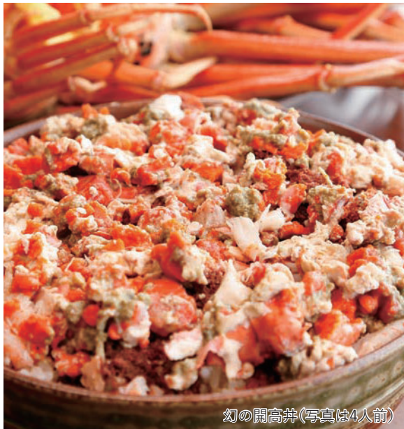
幻の開高井(写真は4人前)