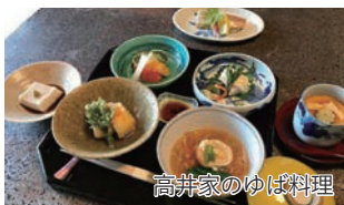
高井家のゆば料理