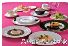
八甲田ホテルの夕食