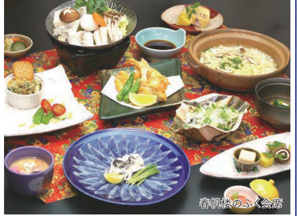
春帆楼のふく会席