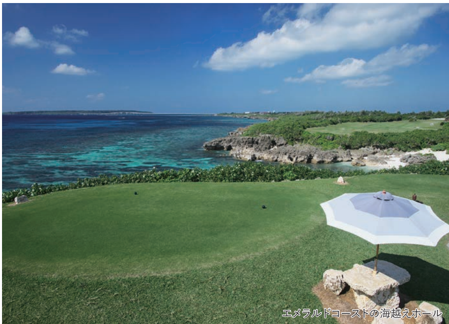
エメラルドコーストの海越えホール

旅のPoint ◎名物の海越えホールや宮古ブルーと称される海を臨むリゾートゴルフをご満喫ください。 ◎南国リゾート宮古島でゆっくりと休日をお過ごしください。ゴルフとフリープランが お選びいただけます。 ◎バスルームとお手洗いがセパレートタイプの「コーラルウィング洋室」もご用意しております。