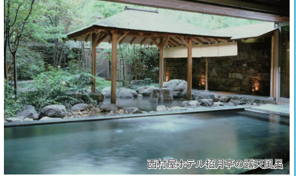
西村屋ホテル招月亭の露天風呂