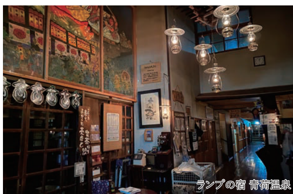
ランプの宿 青荷温泉