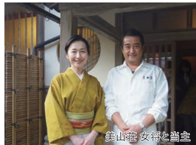
美山荘 女将と当主