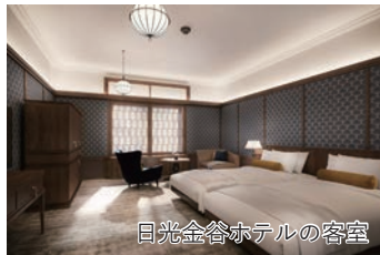
日光金谷ホテルの客室