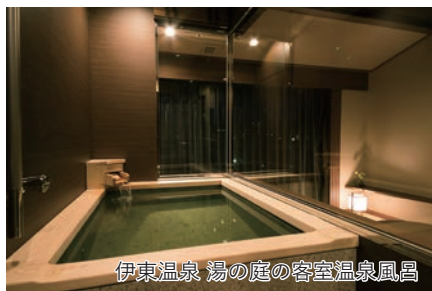
伊東温泉 湯の庭の客室温泉風呂