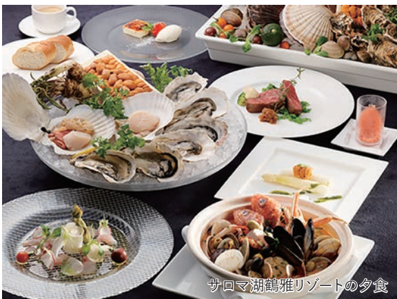
サロマ湖鶴雅リゾートの夕食