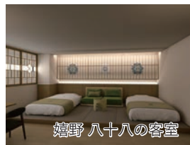
嬉野 八十八の客室