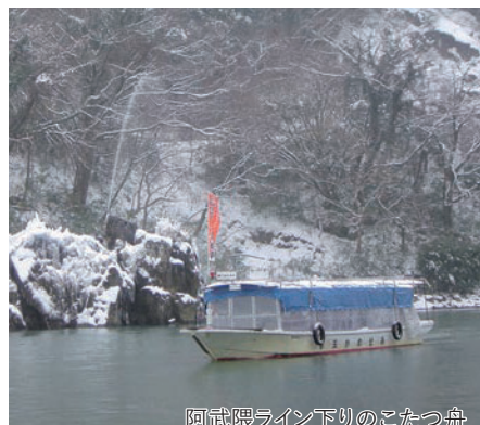
阿武隈ライン下りのこたつ舟