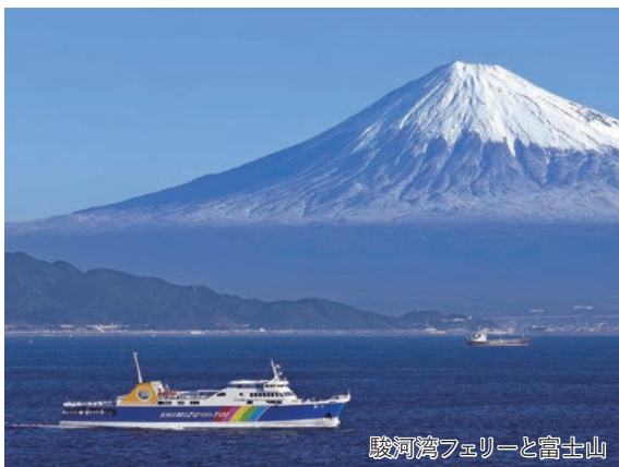
駿河湾フェリーと富士山