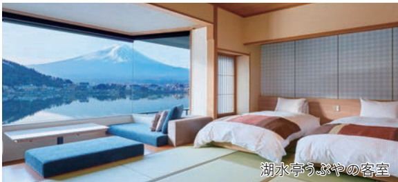
湖水亭うぶやの客室