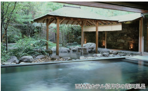
西村屋ホテル招月庭の露天風呂

旅のPoint ◎「活かに」を提供する旅館や宿泊プランを企画する旅行会社が少ない中、今シーズンも「西村屋ホテル招月庭」の宿泊プランをご用意しました。城崎の冬の味覚の王様「松葉かに」をご堪能ください。