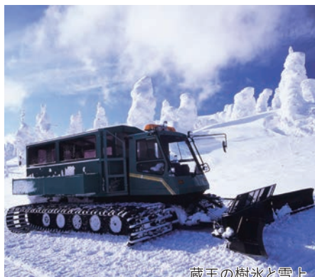
蔵王の樹氷と雪上