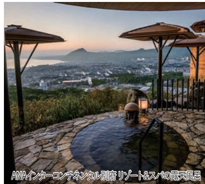
ANAインターコンチネンタル別府リゾート&スパの露天風呂