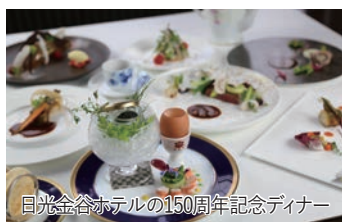
日光金谷ホテルの150周年記念ディナー