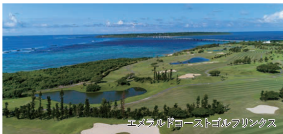
エメラルドコーストゴルフリンクス