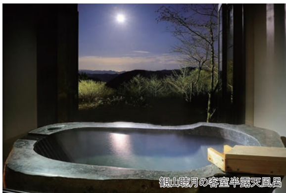
観山聴月の客室半露天風呂