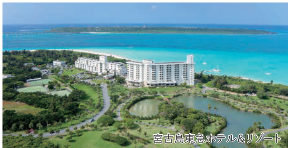
宮古島東急ホテル&リゾート