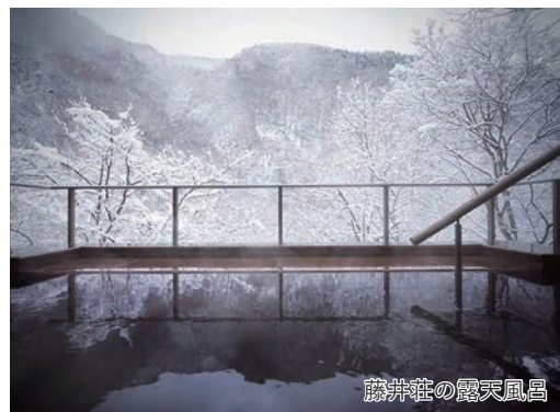
藤井荘の露天風呂