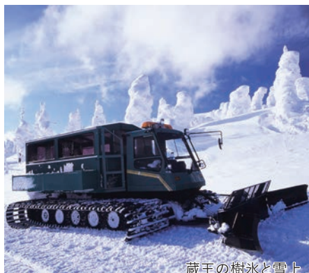
蔵王の樹氷と雪上