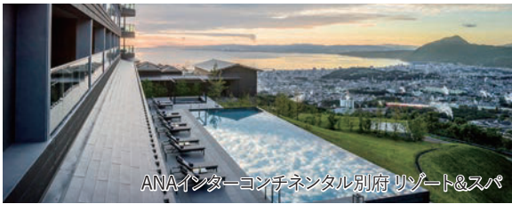
ANAインターコンチネンタル別府リゾート&スパ