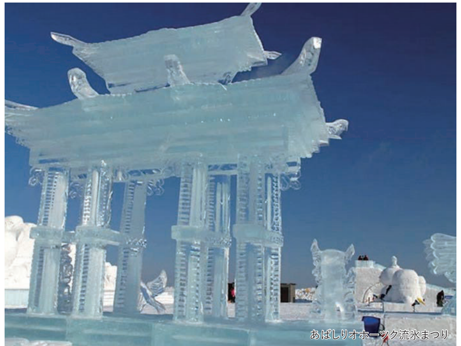
あばしりオホーツク流氷まつり