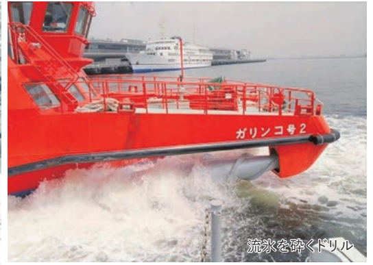
流氷を砕くドリル