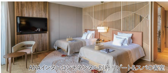
ANAインターコンチネンタル別府リゾート&スパの客室