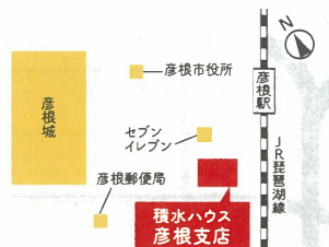
【彦根支店アクセスマップ】