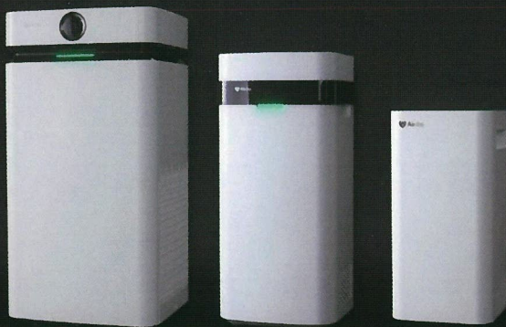
X8 Pro プロフェッショナルモデル