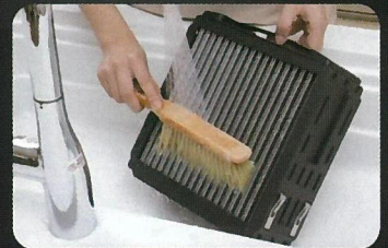
フィルター 水洗いOK