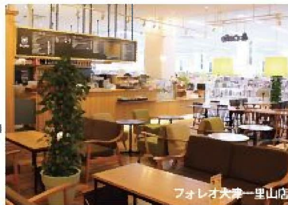
フォレオ大津一里山店

※佛教大学店、佛教大学二条キャンパス店、高島屋京都店、ブックパルデューク箕面店ではご利用いただけません。